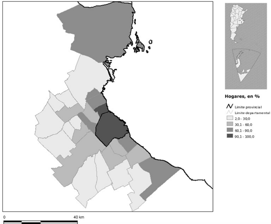
MAPA N° 3. HOGARES CON SERVICIO DE DESAGÜE CLOACAL. AMBA. PORCENTAJES. AÑO 2010