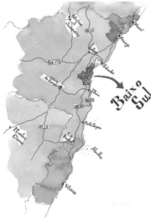
FIGURA 1 - ILUSTRAÇÃO DO TERRITÓRIO BAIXO SUL

Chegar ao Baixo Sul por este caminho permite ao viajante perceber variações importantes que marcam a paisagem dessa região. Percorrendo desde Itabuna as antigas áreas de influência das fazendas de cacau, é bastante nítida a alteração da paisagem à medida em que nos aproximamos de Camamu. A vegetação de Mata Atlântica é ainda abundante e o caminho que passa pelo povoado de Travessão, já no município de Camamu, partindo da BR 101 e descendo a serra em direção ao mar, permite algumas vistas dos vales e da região estuarina do Baixo Sul, descortinando uma paisagem natural exuberante.