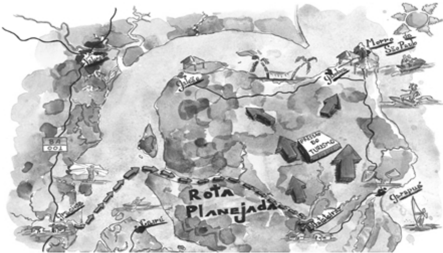
FIGURA 3 - ROTA PLANEJADA PARA EXPANSÃO DO TURISMO NA ILHA DE TINHARÉ

Por sua vez, a empresa Tinhaé chegou como uma proposta de criação de um estacionamento, de um posto de gasolina e de um restaurante, com o objetivo de equipar a área do cais da Graciosa de modo a intensificar o fluxo turístico no local. Assim como em Batateiras, o empreendimento turístico em Graciosa tem função logística, com objetivo de facilitar o acesso às ilhas de Tinhaé e Boipeba, principais pontos turísticos da região do Baixo Sul.